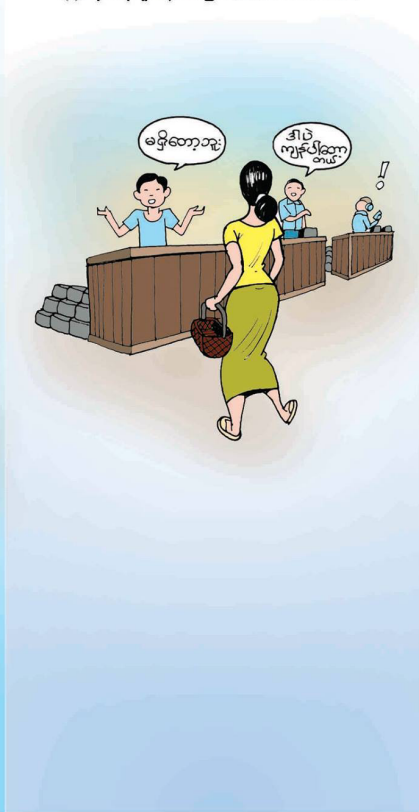
(ဂ) ထုတ်လုပ်မှု ကန့်သတ်ခြင်း (Output Restriction)