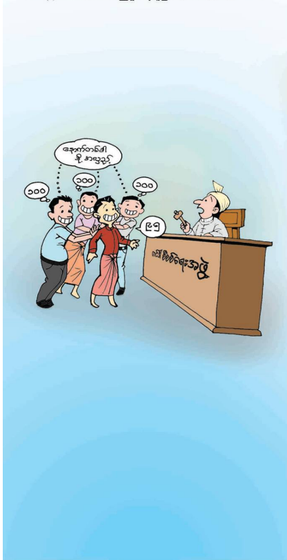
(ခ) လေလံ/တင်ခါညှိနှိုင်းရယူခြင်း (Bid-rigging)