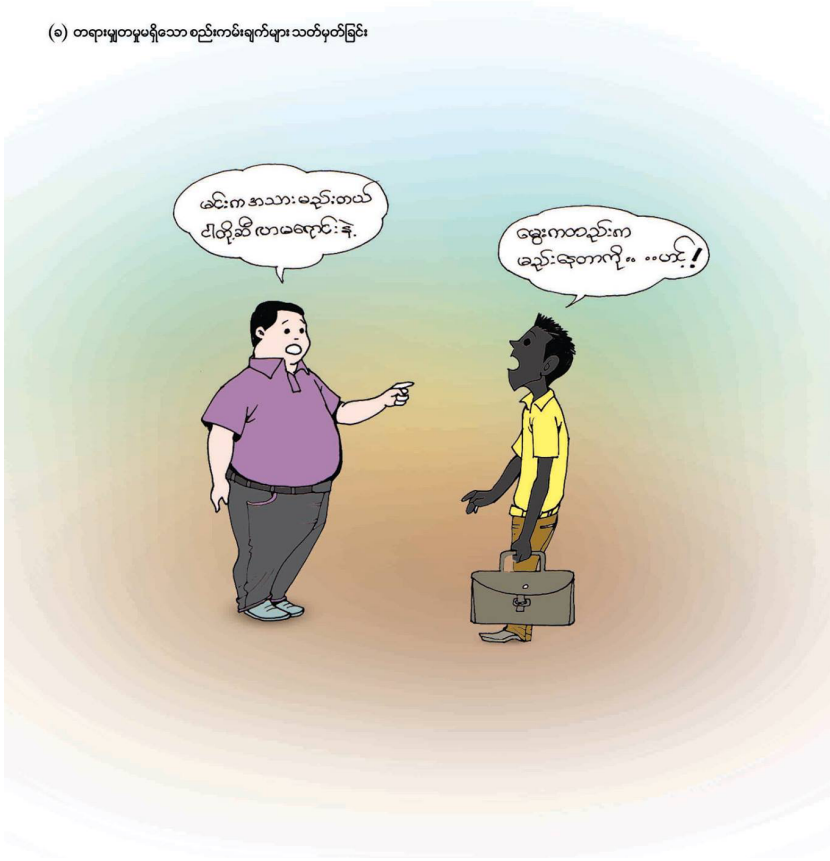
(ခ) တရားမျှတမှုမရှိသော စည်ကမ်းချက်များ သတိပတ်ခြင်း